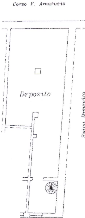
PIANTA PIANO SEMINTERRATO (H= 1,90m)